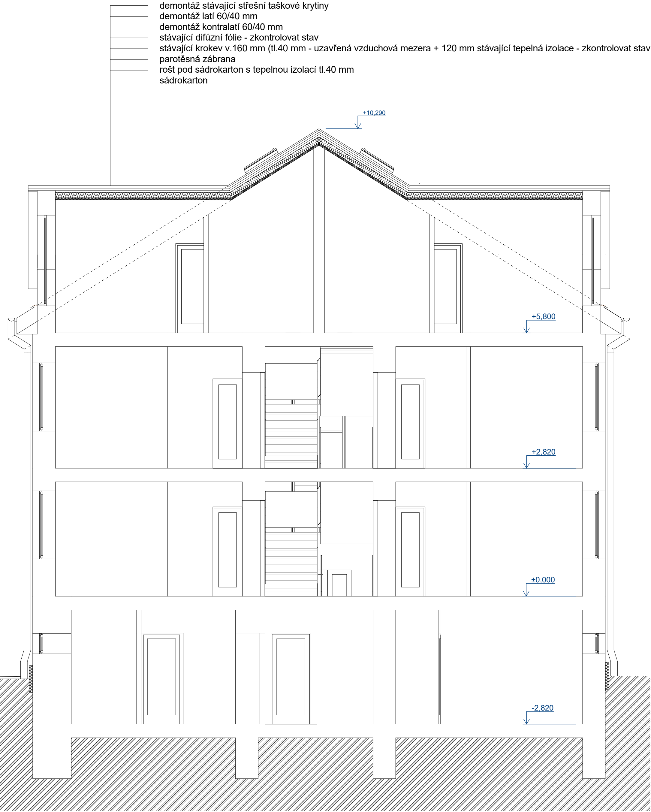
Řez A - A´ - stávající