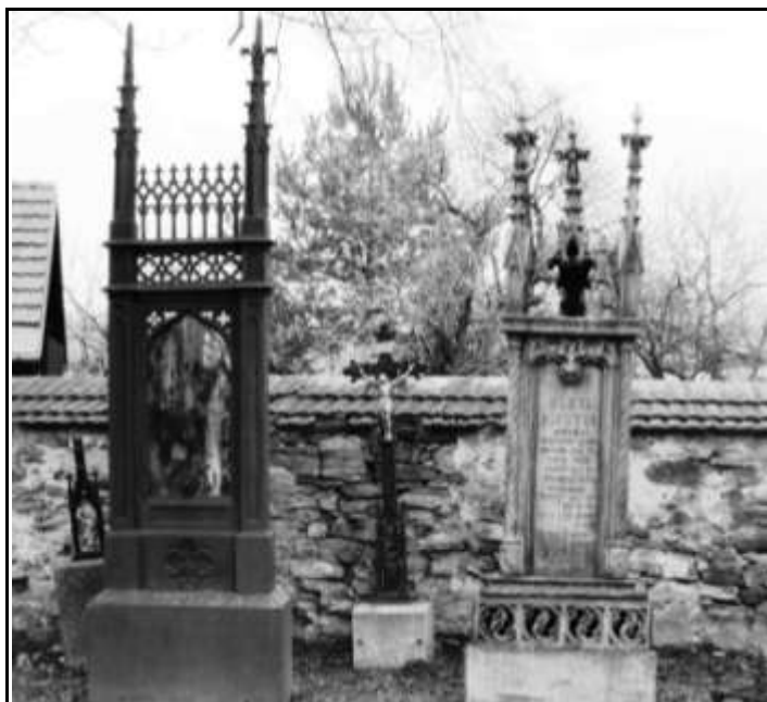
Obr. 2. Hrobová místa 173 a 174 jsou osazena litinovými náhrobky, které jsou sbírkovými předměty z fondu Horáckého muzea. Náhrobky budou restaurovány a zůstanou na tomto místě. Litinový kříž mezi náhrobky u zdi byl věnován autorovi a bude instalován v expozici. Na zdi za náhrobky je dochované litinové označení hrobového místa.

Fotodokumentace prostoru u zdi hřbitova K2/u zdi/173-188 vhodného pro instalaci expozice: