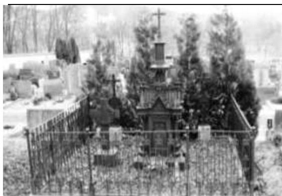
Obr. 1. Hrob dlouholetého správce hutního podniku Mariánské školské nadace Franze Plotzka. Hrob se nachází v poloze K1/1/3-4. a bude součástí expozice. Hrob je upraven a restaurovaný litinový náhrobek je ve velice dobrém stavu. Hrob Franze Plotzka s litinovým náhrobkem zůstane na původním místě a bude na něj upozorněno na informační tabuli expozice. Hrob převzalo do péče město.

Jak vyplývá z výše uvedené tabulky, je prostor pro expozici tvořen volnými hrobovými místy, která se k pohřbívání už nedají použít. Instalace expozice sepulkrální litiny v tomto prostoru proto žádným způsobem neomezí stávající kapacitu hřbitova. Porovnání plánu a skutečnosti ukazuje, že v této oblasti pláněk neodpovídá skutečnosti, že hrobová místa tu jsou zakreslena schematicky v odstupu. V plánu je zakresleno jako poslední hrobové místo č. 187 a poté následuje strom. Ve skutečnosti ale ještě následuje hrobové místo č. 188 a ke stromu ještě zbývá cca 2,5 metru. Místo poskytuje dostatek prostoru k estetickému rozmístění exponátů.