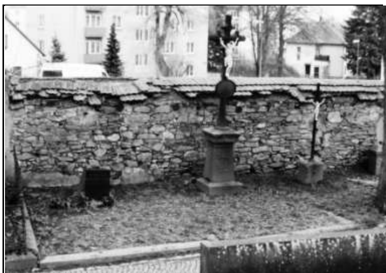
Obr. 4. Hrobová místa č. 179 - 182. Sokl bez kříže bude odstraněn, kříže budou restaurovány a ponechány na původních místech, stejně tak jako litá čísla hrobových míst na zdi. Prostor bude doplněn litinovými kříži na soklu a litinovými kříži bez soklů, které budou připevněny na zeď.

(litinové oplocení je obnoveno poz. 2019)