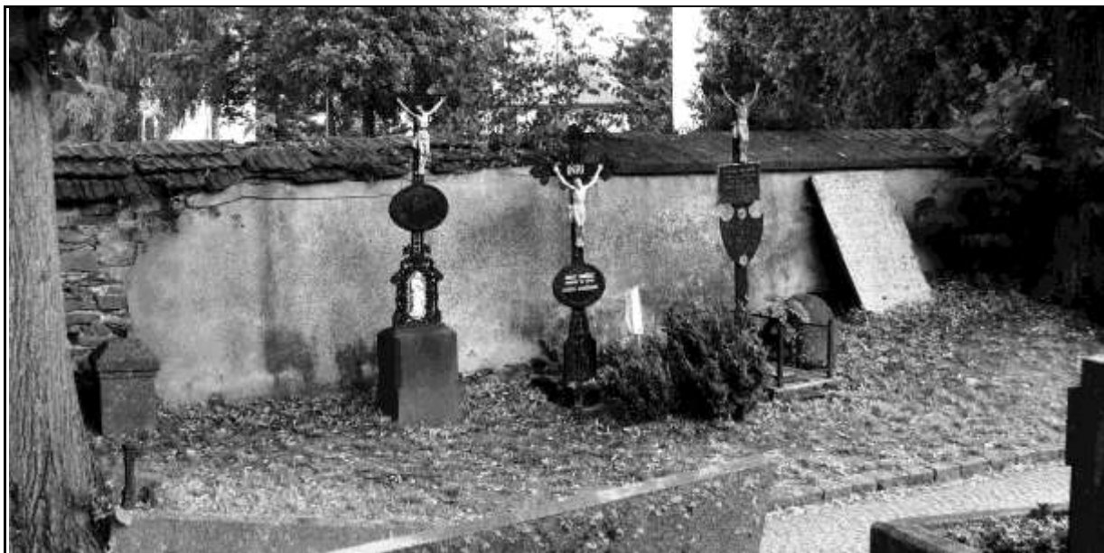
Obr. 5. Hrobová místa č. 183 - 188. Sokl bez kříže bude odstraněn, kříže budou restaurovány a ponechány na původních místech. Prostor bude doplněn dalšími litinovými kříži na soklu a litinovými kříži bez soklů, které budou připevněny na zeď.