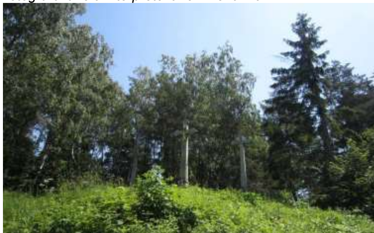
Pohled na kříže dnes.